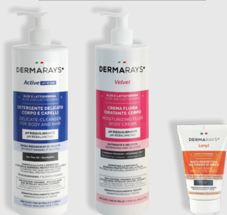
Active All in One 500ml / 1000ml