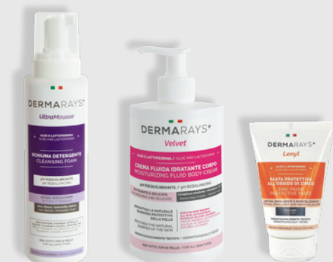
Ultra Mousse 500ml