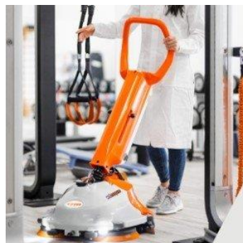
Lavasciuga WILLMOP 50