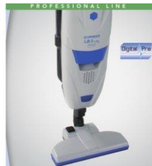
Scopa elettrica LB3-L-Ion digital pro 36V LINDHAUS