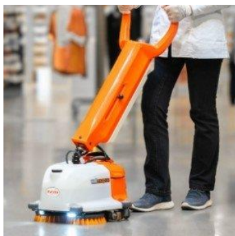
Lavasciuga WILLMOP 35